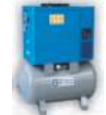
CSAVAR ÉS DUGATTYÚS KOMPRESSZOROK